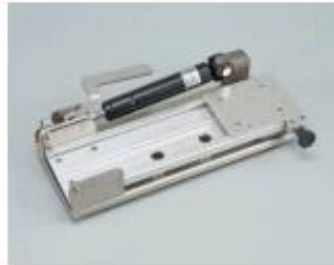
22. Free lock block