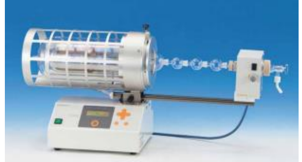
GTO-3000 회전 가열형