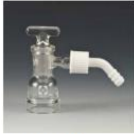
9. 배기 아답터