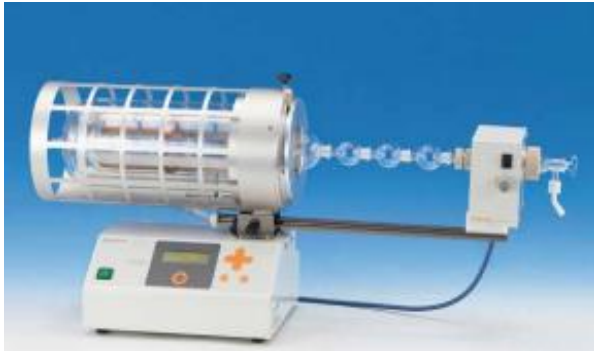
GTO-3000 회전 가열형