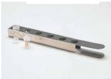
31. 칭량병 홀더