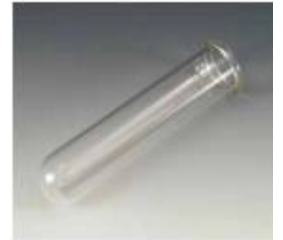
30. 건조관 ø50