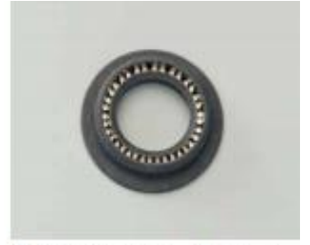
6. 기밀 씬