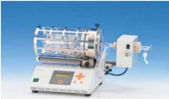
GTO-2000 회전 가열형