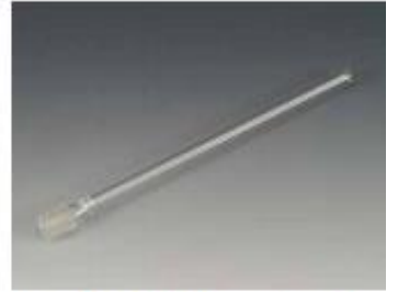
18. 센터 조인트