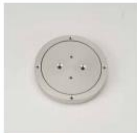
37. 턴 테이블 GTO-2000용