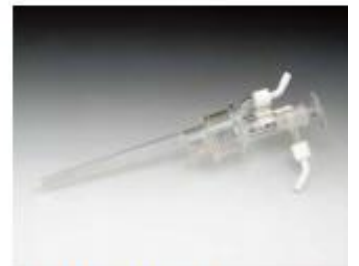
40. 승화용 냉각기