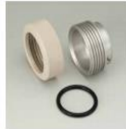
24. 유리부 홀더