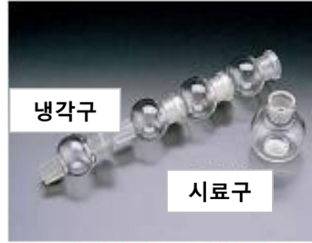
11. 냉각구 16. 시료구