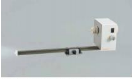
1. 회전부 유닛