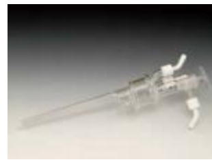
승화용 냉각기 (옵션)