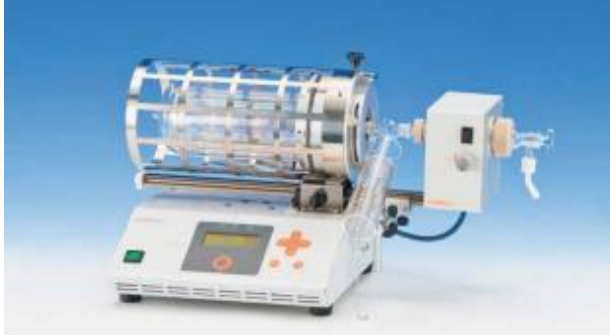
GTO-2000 회전 가열형