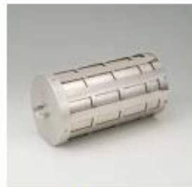
38. 적외선 반사등 GTO-2000용