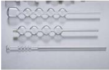
19. 트랩 10mL 21. 트랩구 연결용 20. 트랩 미량용