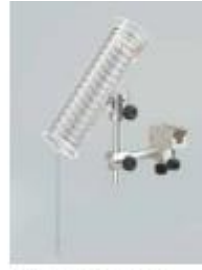
4. 클링 유닛